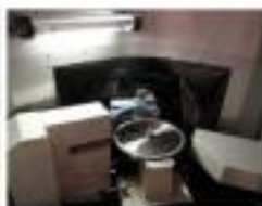
PREMIUM General operating area.