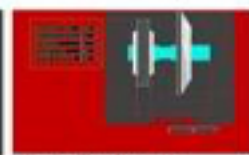
Wheel calibration screen