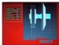
PREMIUM Grinding wheel screen.