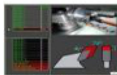
Broken tooth and repair tooth screen