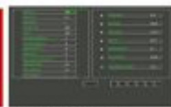
Parameter input screen