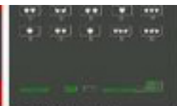
Form selection screen