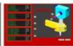
Measuring probe calibration screen