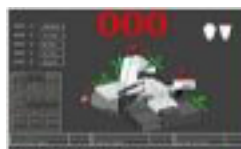
General operating screen