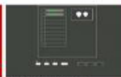
New blade save screen