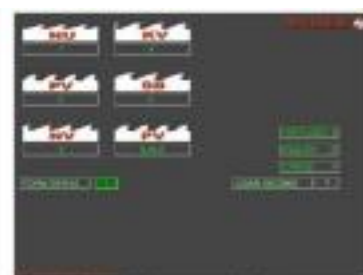
Form and language selection screen