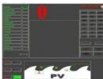
PNK-CNC General operating screen