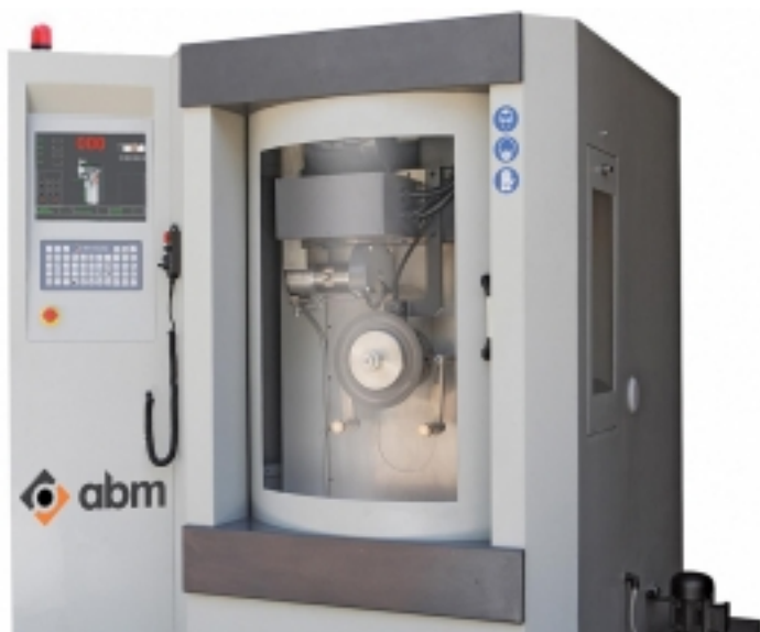
Axes of the Machine: