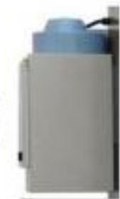
Integrated air suction unit