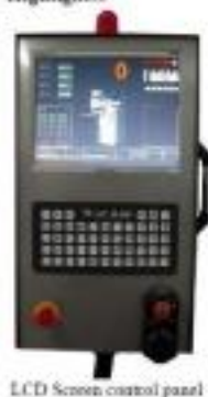
LCD Screen control panel