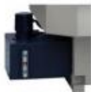
Manual pulse handler

ca. 60lt capacity coolant container with a level indicator