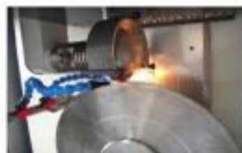
HSS circular saw grinding

ca. 60lt capacity coolant container with a level indicator